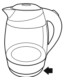
Рисунок - 3

— Наполните чайник холодной водой, следите за метками.