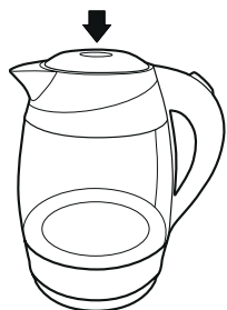
Рисунок - 1