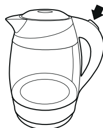
Рисунок - 4

— Включите чайник, нажав кнопку (переведя выключатель в положение 1).