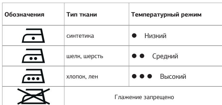
Таблица может быть использована только для гладких тканей. Если на ткани присутствует рельеф, оборки, нашивки и прочие декоративные элементы, рекомендовано производить глажение при низких температурах.

Перед началом работы изучите информацию о допустимых режимах глажения на ярлыке изделия. В случае если ярлык с рекомендациями отсутствует, но известен материал изделия, обратитесь к таблице.