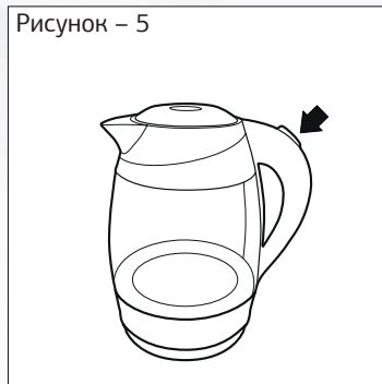
Рисунок – 5

— Перед снятием с базы убедитесь в том, что чайник выключен (переключатель в положении 0).