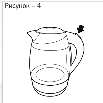
Рисунок – 4

— Включите чайник, нажав кнопку (переведя выключатель в положение 1).