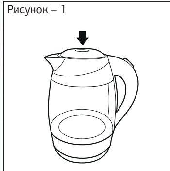
Рисунок – 1