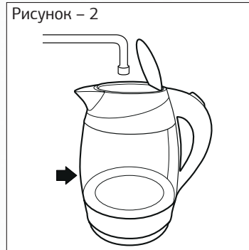
Рисунок – 2

— Наполните чайник холодной водой, следите за метками.