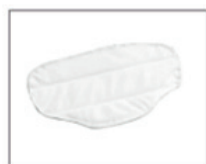
Две тряпки для мытья пола