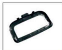
Насадка для чистки ковров